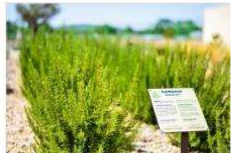
The Mediterranean Garden