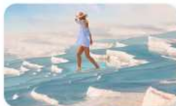
ปราสาทปูยฝาย