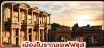
เมืองโบราณเอเฟซุส