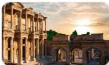
เมืองโบราณเอฟเฟซุส