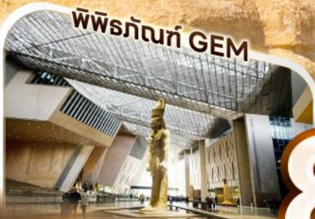
พิพิธภัณฑ์ GEM