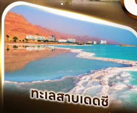
ทะเลสาบเดซี