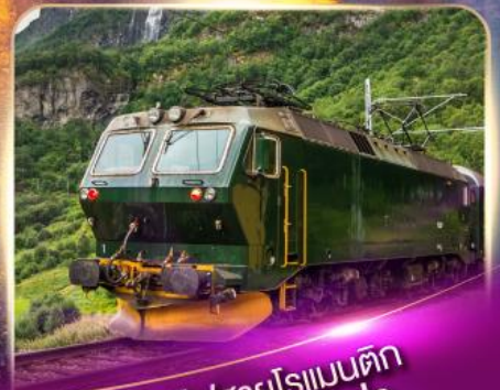
รถไฟสายโรแมนติก ฟลิมส์บาน่า