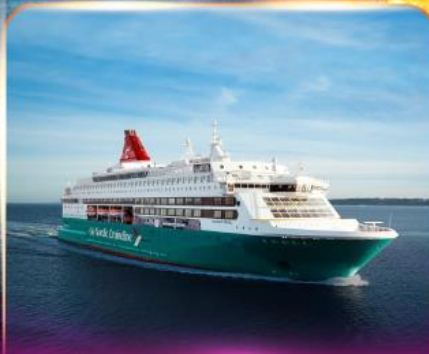
เรือสำราญ GO NORDIC CRUISE LINE