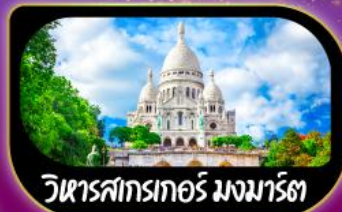
วิหารสกรเทอร์ มงมาร์ต