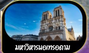
มหาวิหารนอทรอดาม