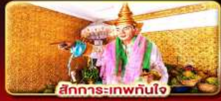
สิทธิการะเทพทันใจ