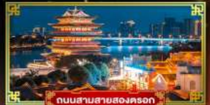
ถนนสามสายสองตรอก