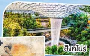
สิงคโปร์